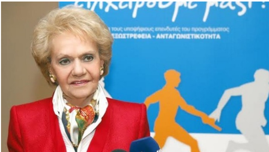
Η πρόεδρος του ΠΣΕ

-Το παραγωγικό μοντέλο ασφαλώς πρέπει και μπορεί να αλλάξει. Είναι επιτακτική ανάγκη να ενισχύσουμε την εγχώρια παραγωγή και να τονώσουμε την εξωστρέφειά μας. Πέραν των παραδοσιακών προϊόντων, χρειάζεται μια στροφή προς νέα καινοτόμα προϊόντα, τα οποία θα ενσωματώνουν τις τεχνολογικές εξελίξεις, αλλά και προϊόντα που θα απαντούν στις καινούριες ανάγκες των ξένων καταναλωτών.