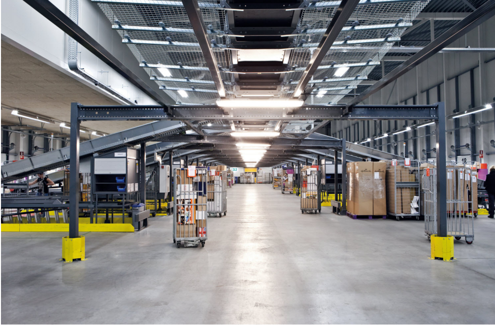
Στα πολύ θετικά

στοιχεία, οι πολύ συχνές εναλλαγές εγκαταστάσεων, προϊόντων, εταιρικών ειδικών αναγκών και επαφών με διαφορετικά στελέχη και εταιρικές κουλτούρες.